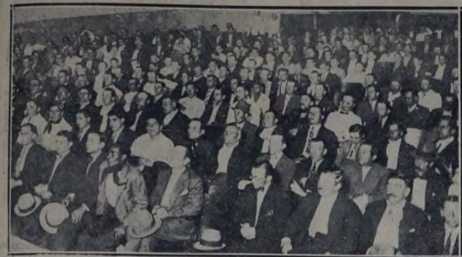
VISTA DE LA CONCURRENCIA A LA ASAMBLEA DEL PERSONAL DEL MATADERO MODELO

Quedan invitados los obreros que trabajan en el tejido de punto a la asamblea general que se realizará el sábado 29 a las 21 horas, en el local de la calle Lavalle 2819, donde se tratará el siguiente orden del día: Acta anterior; Situación por que atraviesa el gremio; Nombramiento de la comisión; Asuntos varios. Esta Federación pide a todos los obreros de la industria, denuncien